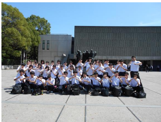
3日目上野公園散策【国立西洋美術館】