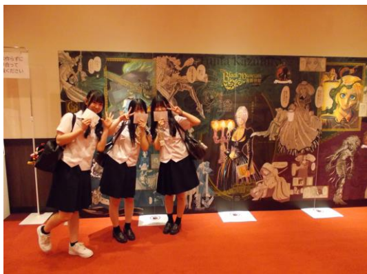
劇団四季観劇【ゴースト&レディ】