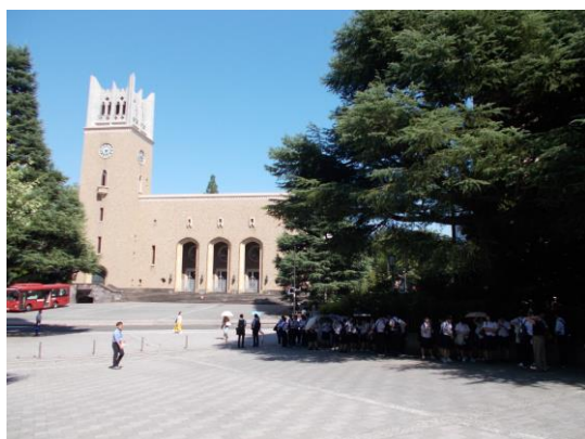
早稲田大学【大隈講堂】