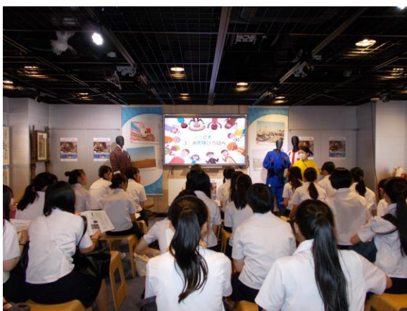
研修2日目 施設企業見学より 【JICA 地球ひろば】