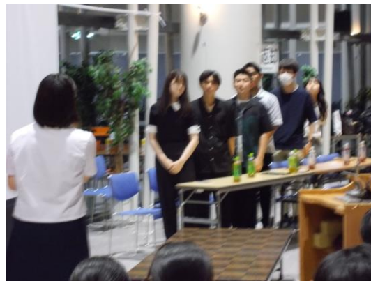
先輩に聞く【生徒代表 謝辞】