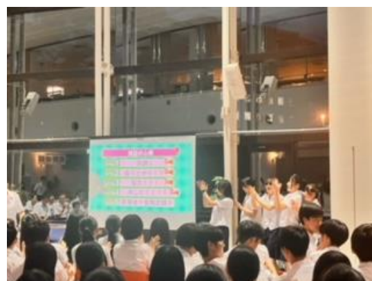
学年交流会【クラス対抗クイズ大会】